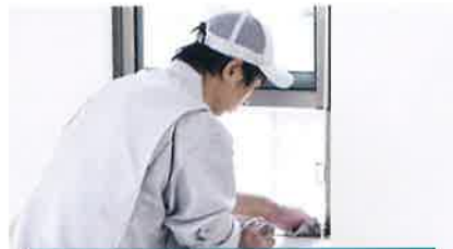
丁寧な清掃でキレイな住空間