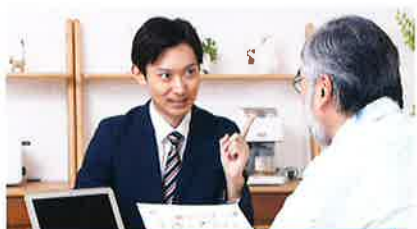
効果的なリフォーム提案