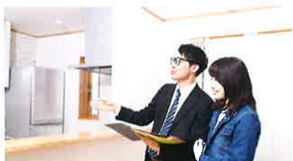
快適な内覧で成約率アップ

パナソニック ホームズ不動産の賃貸管理で 入居者に「心地よい暮らし」を、オーナーさまに「生涯満足経営」を。